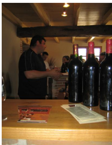
Dégustation au Domaine de Sarrabelle, Les Fortis, L'Isle-sur-Tarn (81)