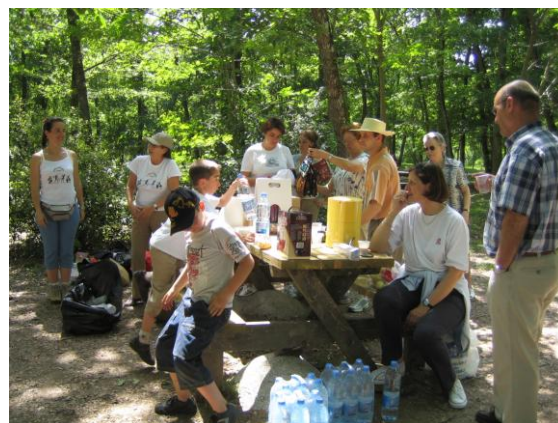
Pique-nique à la Forêt de Sivens (81)

Le tout, en une journée, dans une super ambiance et avec le soleil ! « Va falloir faire aussi bien la prochaine fois », disent les participants. Mais quelle pression !