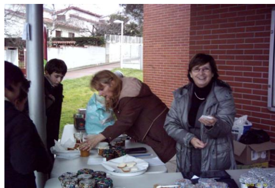
Rencontre à l'école élémentaire de Marie Laurencin à Balma