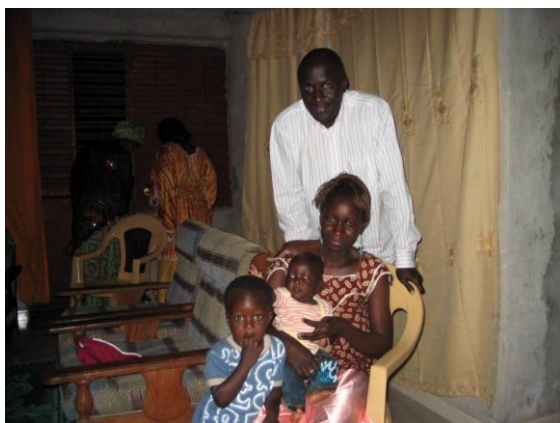
Kéba en famille