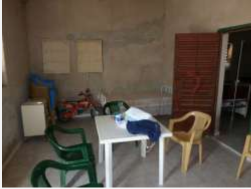
Action Trousses d'écolier