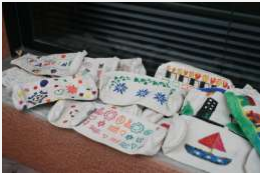
Dessins des enfants de l'école Kéba THIAM